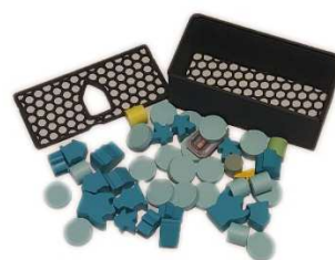
4x-krabička hráčů - poz.5