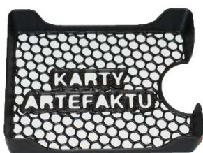
Krabička pro karty Artefaktů - poz. 9