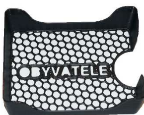
2x lišta pro nabídku karet Obyvatel - poz. 4