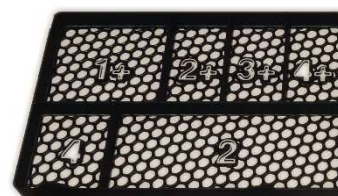
Krabička pro žetony Velkých a Malých Artefaktů, destičky Konce hry – poz.12