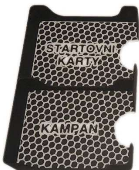
Krabička pro Startovní karty a karty Kampaně – poz.7