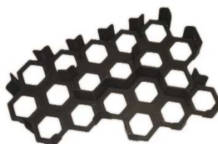
Uložení destiček Oblastí a Velkých nalezišť - poz.11