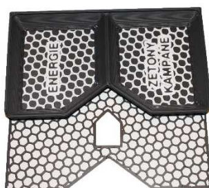
Krabička pro žetony Energií a kampaně – poz.6